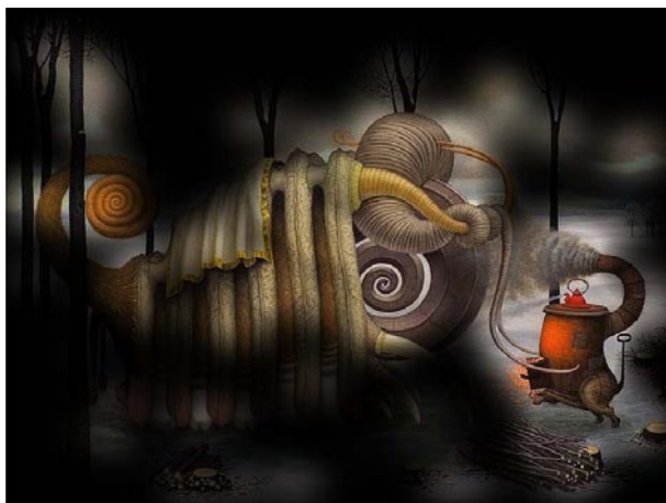
Rys. 6. Odwrócona mapa cieplna

c) odwróconej mapy cieplnej – uwidacznia jakie elementy oglądanego obrazu zauważył badany (rys. 6);