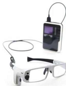
Rys. 2. Przykład eye trackera : a) stacjonarnego – Tobii TX300, b) mobilnego – Tobii Glasses