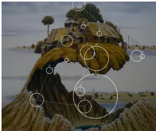
Rys. 4. Ścieżki skanowania

a) ścieżek skanowania – wskazują kolejność postrzegania poszczególnych obszarów. Dodatkowo, ścieżki skanowania pozwalają zidentyfikować elementy odwracające uwagę od głównej treści przekazu (rys. 4);