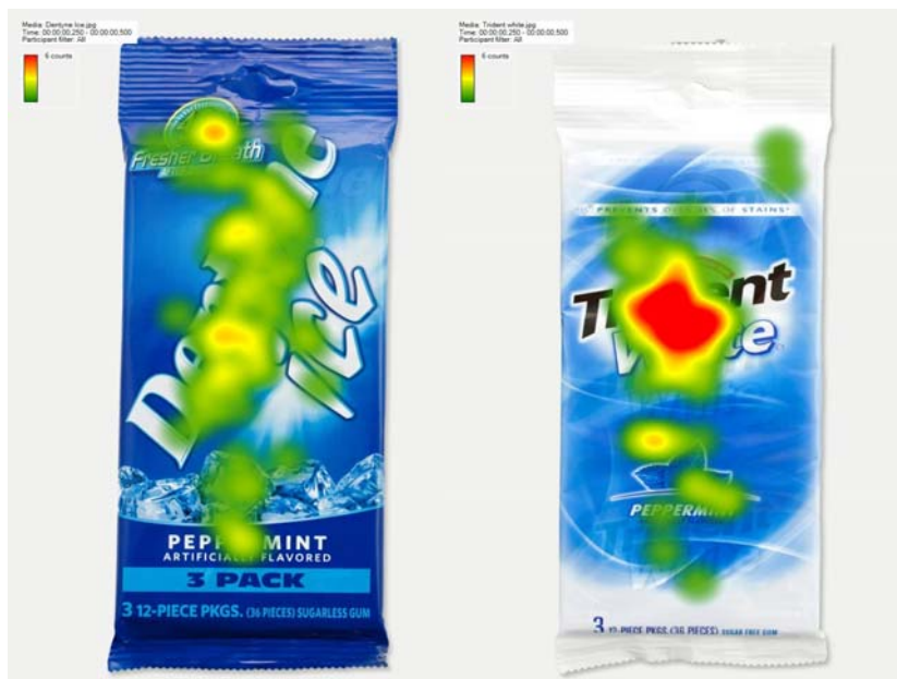
Rys. 8. Sumaryczne wyniki skupienia uwagi