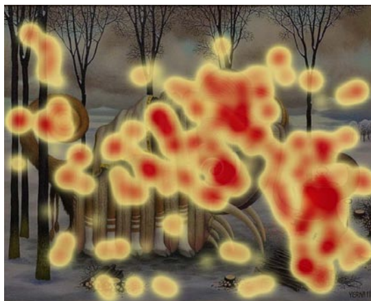
Rys. 5. Mapa ciepła

b) mapy ciepłej – przedstawia sumaryczne wyniki skupienia uwagi dla danej grupy respondentów. Pozwala określić, które elementy oglądanego obrazu przykuwały uwagę w największym stopniu oraz te, które badani pomijali (rys. 5);