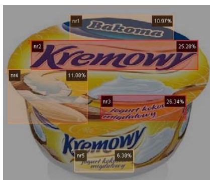
Rys. 7. Obszary zainteresowań

d) obszarów zainteresowań – wydzielone obszary z procentowym zapisem rozkładu uwagi przedstawione np. w formie nałożonych na oglądany obraz półprzezroczystych warstw zawierających procentowy opis tego, w jakim stopniu poszczególne elementy przykuwały uwagę. Dla takich obszarów można generować różne statystyki (rys. 7).